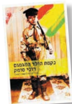
"נקמת הילד המגמגם", קובץ שיריו החדש של רוני סומק (כנרת זמורה ביתן, 2017)

רוני סומק הוא אחד המשוררים הפוריים בתקופתנו. שירתו ייחודית, רוויית מטפורות, דימויים וציורים עזי מבע. סומק, שהוא גם מורה, אומר: "אני קבלן שיפוצים של מה שאני עצמי עברתי", אך כאשר הוא מפרט את חוויותיו כתלמיד הוא אסיר תודה לכמה ממוריו