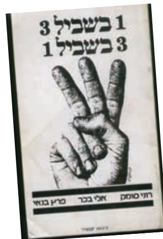
ספרון שירה, 31 עמודי שירה לשלושה משוררים. הוצאת עכשיו, 1980

בספרון "1 בשביל 3, 3 בשביל 1" ברכו יחד שירים שלך עם שירים של אלי בכר ושל פריץ דרור בנאי. שלושה משוררים צעירים "מזרחיים". איך אתה רואה את הספרון הזה בפרספקטיבת השנים שחלפו?